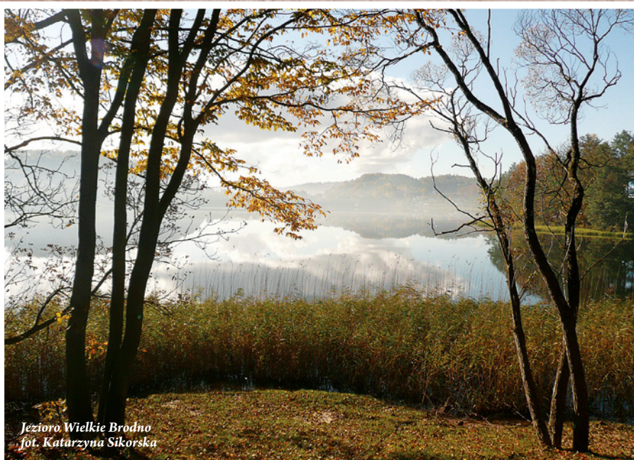
Jezioro Wielkie Brodno

Dzisiejszy charakter sieci hydrograficznej na obszarze Kaszubskiego Parku Krajobrazowego jest wynikiem działalności procesów związanych z ostatnim zlodowaceniem oraz działalnością człowieka. Są tu liczne jeziora, rzeki, mokradła, bagna, trzęsawiska oraz zagłębienia bezodpływowe powierzchniowo, charakterystyczne dla obszaru młodoglacjalnego. Na obszarze Kaszubskiego Parku Krajobrazowego łączna powierzchnia akwenów wodnych wynosi 3 145 ha, co w zestawieniu z obszarem Parku określa jego jeziorność jako bardzo wysoką w skali Polski. Występuje tu 48 jezior o powierzchni powyżej 1 ha oraz około 500 zbiorników mniejszych od 1 ha. Największymi i najbardziej rozpowszechnionymi typami jezior są jeziora