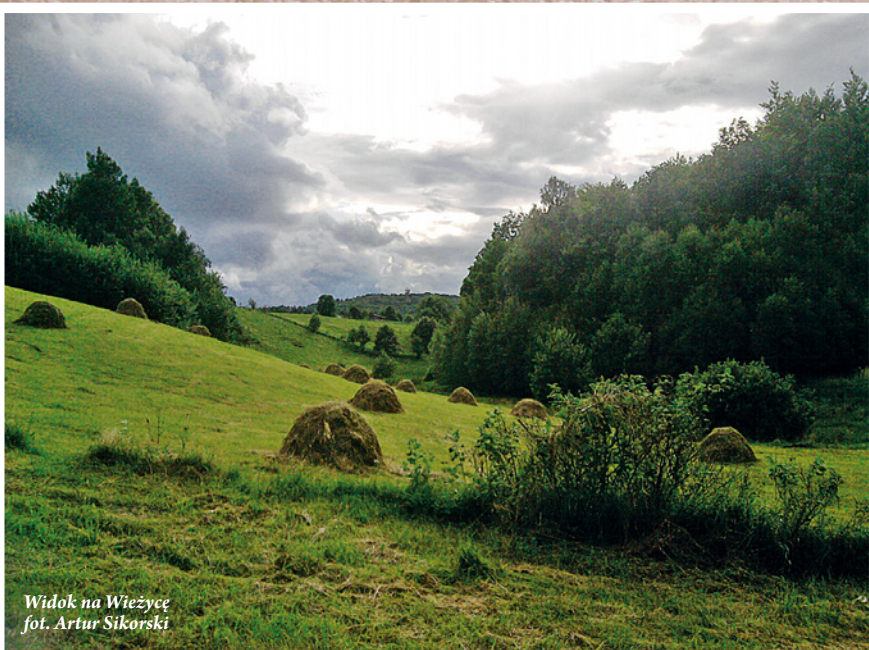
Widok na Wieżycę

W granicach Parku wytyczono również ścieżki ekologiczne i przyrodniczo - dydaktyczne. Pracownicy Kaszubskiego Parku Krajobrazowego prowadzą całoroczną edukację przyrodniczo - ekologiczną dla dzieci i młodzieży w formie zajęć w szkołach i we własnej