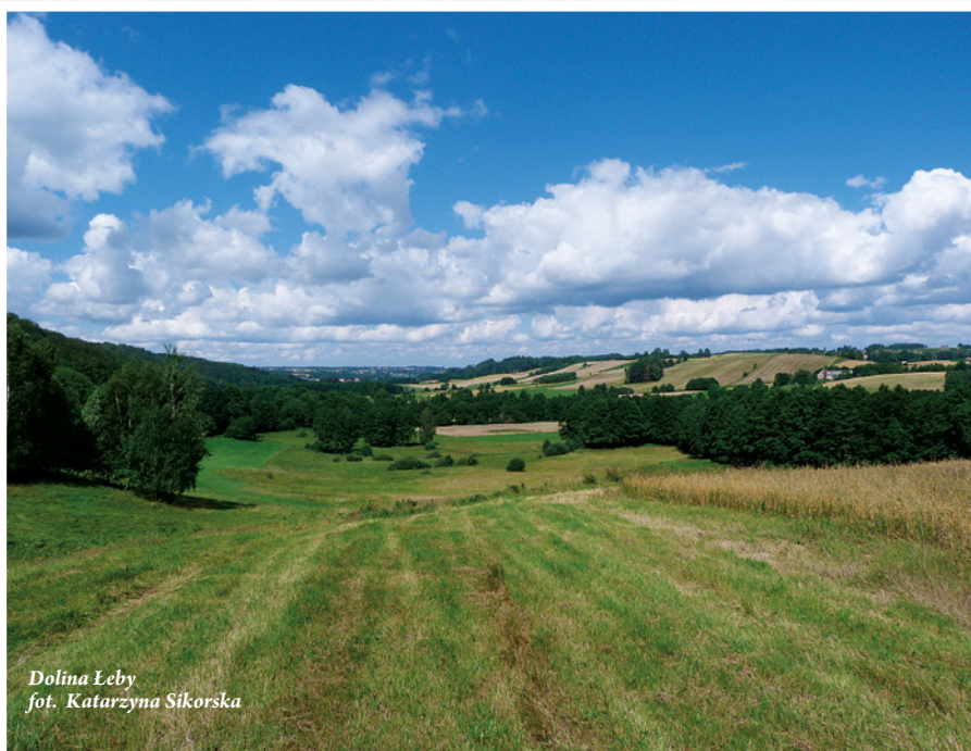
Dolina Leby

Kaszubski Park Krajobrazowy utworzony w 1983 roku, położony jest w całości na obszarze Pojezierza Kaszubskiego i zajmuje jego centralną część. Swym zasięgiem obejmuje zespół rynnowych Jezior Raduńskich, Wzgórza Szymbarskie oraz kompleks Lasów Mirachowskich.