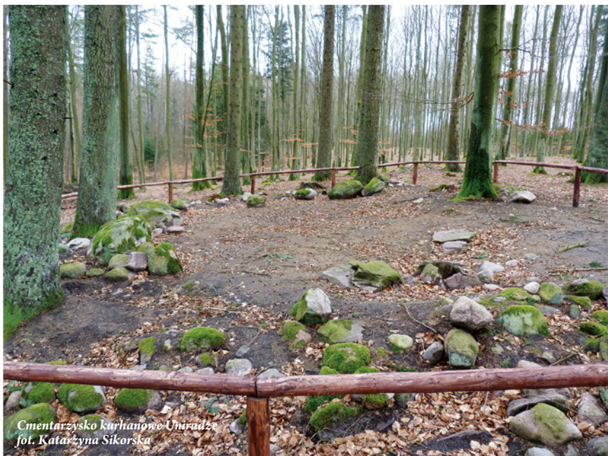
Cmentarzysko Kurhanów w Uniradzu

Kaszubski Park Krajobrazowy posiada liczne walory przyrodnicze i kulturowe mające znaczenie dla wypoczynku pobytowego, turystyki krajoznawczej oraz kwalifikowanej. Jeziora połączone biegiem Raduni tworzą tzw. „Kółko Raduńskie” o łącznej długości około 40 km. Sprzyja to rozwojowi różnych form turystyki i rekreacji, daje bardzo dobre możliwości żeglarskie, kajakarskie, kąpieliskowe i dobre warunki dla wędkowania. Na obszarze KPK znajdują się początkowe źródła dwóch największych rzek regionu Raduni i Łeby, które posiadają walory rekreacyjne ze względu na możliwości uprawiania kajakarstwa. Urozmaicona rzeźba terenu, a więc znaczne różnice wysokości względnych, ekspozycja stoków, obfitość obniżen sprawia, że na terenie Kaszubskiego Parku Krajobrazowego są znakomite warunki do uprawiania sportów zimowych, takich jak zjazdy i biegi narciarskie, kuligi czy saneczkarstwo. Na terenie Parku można poruszać się po znakowanych szlakach turystyki pieszej, kajakowej, rowerowej, konnej, wyciągach narciarskich, szlakach nordic walking oraz wycieczkowej trasie samochodowej tzw. „Drodze Kaszubskiej”.