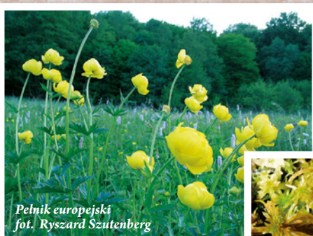
Pętnik europejski

Sieć rzeczna na terenie Kaszubskiego Parku Krajobrazowego jest dość słabo rozwinięta i ma charakter inicjalny. Obszar Parku jest obszarem źródłiskowym dla takich rzek jak: Radunia, Wierzyca, Łeba i Słupia (w otulinie Parku).