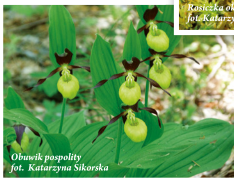
Obuwik pospolity

Flora roślin naczyniowych występująca na terenie Kaszubskiego Parku Krajobrazowego liczy około 700 - 800 gatunków i do dziś nie wszystkie z nich są w pełni zbadane. Duży udział mają tu rośliny wodne, a z lądowych wilgociolubne torfowiska wysokich i źródlisk. Blisko 190 gatunków należy do roślin prawnie chronionych np. pętnik europejski, rosiczka okrągłolistna czy obuwik pospolity.