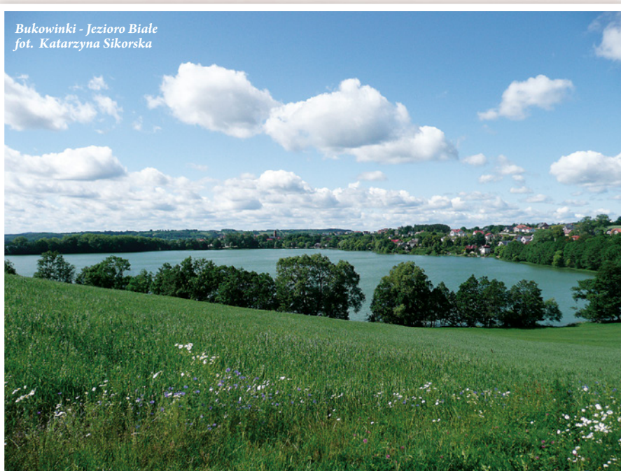
Bukowinki - Jezioro Białe

rynnowe o charakterystycznym wydłużonym kształcie. Należy również wspomnieć o licznych zagłębieniach bezodpływowych wypełnionych wodą w centralnej części KPK, stanowią one 45 % powierzchni Parku. W KPK można wyróżnić dwie duże grupy jezior, są to: Jeziora Potęgowskie (zespół 10 jezior) oraz Jeziora Raduńskie (zespół 14 jezior).