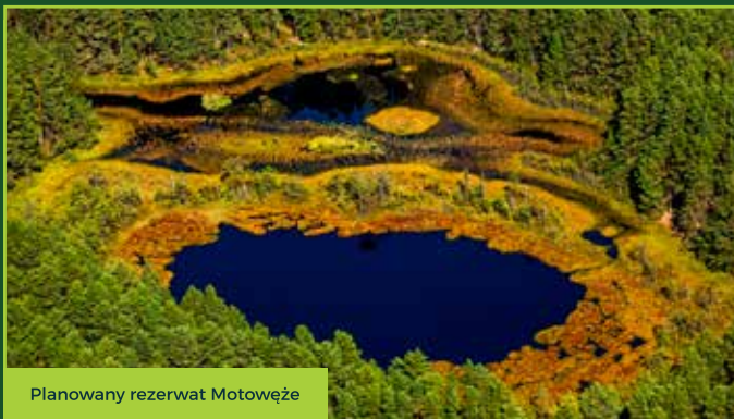
Planowany rezerwat Motowężę

Wdzydzki Park Krajobrazowy położony na rozległej równinie Sandrowej nachylonej w kierunku południowym, w przedziale wysokości od około 160 do 140 m n.p.m. Osady budujące pole sandrowe to piaski i żwiry. Teren Parku licznie porożcinany jest rynnami polodowcowymi, zagłębieniami wytopiskowymi, dolinami rzecznyymi, niewielkie powierzchniowo występują tu również wysoczyzny morenowe w postaci tzw. „wysp morenowych”. Rynny subglacjalne wypełnione są wodami jezior. Zagłębienia wytopiskowe po bryłach martwego lodu często tworzą oczka wodne, najpłytsze wypełnione