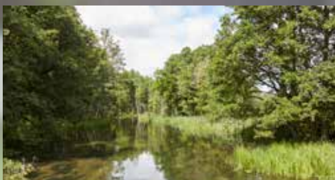
Krajobraz Borów Tucholskich