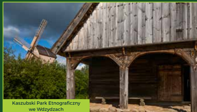
Kaszubski Park Etnograficzny we Wdzydzech

Plan ochrony parku krajobrazowego to dokument mający na celu zabezpieczenie skutecznej ochrony opisanych szczegółowo walorów przyrodniczych, kulturowych i krajobrazowych. Przedmioty ochrony podlegają presji zewnętrznej i wewnętrznej i zgodnie z art. 16 obowiązującej ustawy o ochronie przyrody muszą być chronione „...ze względu na wartości przyrodnicze, historyczne i kulturowe oraz walory krajobrazowe w celu zachowania i popularyzacji tych wartości w warunkach zrównoważonego rozwoju.” Plan ochrony Parku Krajobrazowego sporządza się na okres 20 lat. Składa się on z charakterystyki i oceny stanu przyrody, identyfikacji i oceny istniejących oraz potencjalnych zagrożeń wewnętrznych i zewnętrznych, charakterystyki i oceny uwarunkowań społecznych i gospodarczych, analizy skuteczności dotychczasowych sposobów ochrony, charakterystyki i oceny stanu zagospodarowania przestrzennego, wyników audytu krajobrazowego, o którym mowa w art. 38a ustawy z dnia 27 marca 2003 r. o planowaniu i zagospodarowaniu przestrzennym.