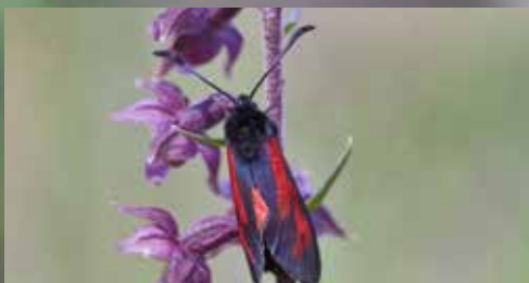
Kruszczyk rdzawoczerwony i kraśnik pięciopłamek