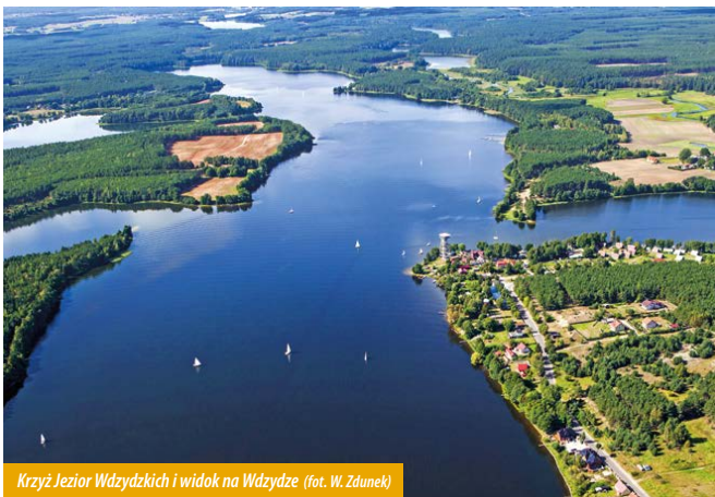
Krzyż Jezior Wdzydzkich i widok na Wdzydze

koniecznie trzeba udać się do Stacji PTTK, gdzie znajduje się wieża widokowa i wiata edukacyjna. Z tarasów widokowych rozciąga się piękny widok na cztery jeziora wdzydzkie – Wdzydze, Radolne, Gołuń i Jelenie, które łączą się w unikatowy kształt krzyża, a także wyspy i liczne półwyspy jeziorne oraz panoramy wsi. Cennym źródłem informacji, między innymi o poszczególnych wyspach, parku i Wdzydzech, są tablice edukacyjne umieszczone pod wiatą i w otoczeniu wieży. Stąd niedaleko jest do przystani „U Grzegorza”, gdzie można udać się w godzinny rejs po jeziorze Wdzydze statkiem „Stolem II”. Z kolei na północ od Wdzydz wytyczono pieszą ścieżkę, która zaskakuje bogactwem naturalnego środowiska w tak bliskim sąsiedztwie wsi. Wyposażona jest w liczne tablice edukacyjne i ukazuje charakter krajobrazu Wdzydzkiego Parku i jego walory przyrodnicze.