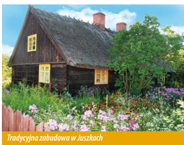
Tradycyjna zabudowa w Juszkach

zabudowę, charakterystyczną dla tej części Kaszub. Układ ruralistyczny wsi również został wpisany do rejestru zabytków. Na uwagę zasługują również nowo powstałe domy, utrzymane w tradycyjnej stylistyce, dzięki czemu znakomicie wtapiają się w krajobraz wsi nie zakłócając jego harmonii.