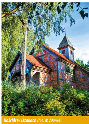
Kościół w Lizakach

Dalej szlak prowadzi nas do wsi Lizaki, gdzie warto zobaczyć urokliwy XVIII-wieczny kościółek z zabytkowym prezbiterium (przeniesiony z Tyłowa, gmina Krokowa) oraz sąsiadującą z nim chatę (przeniesiona z Pieniżnicy, gmina Rzeczenica), które wpisane są w rejestr zabytków nieruchomych woj. pomorskiego. Za Lizakami mijamy niewielkie jezioro Wałachy i docieramy do kolejnego przystanku z tablicą o roślinach leczniczych borów i wiatą do odpoczynku. Poznamy tu prozdrowotne właściwości roślin powszechnie występujących na terenie WPK.