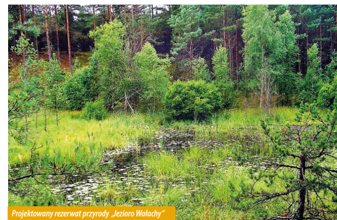
Projektowany rezerwat przyrody „Jezioro Wałachy”