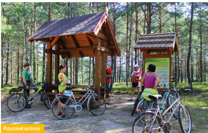
Przystanek na trasie

Kontynuując wycieczkę mijamy rzeczkę Dębrzyca i wspinamy się na wznie-sienie, skąd już równa, prosta droga prowadzi nas do kolejnego przystanku w urokliwej wsi Juszkach. Warto zobaczyć tam tradycyjną regionalną