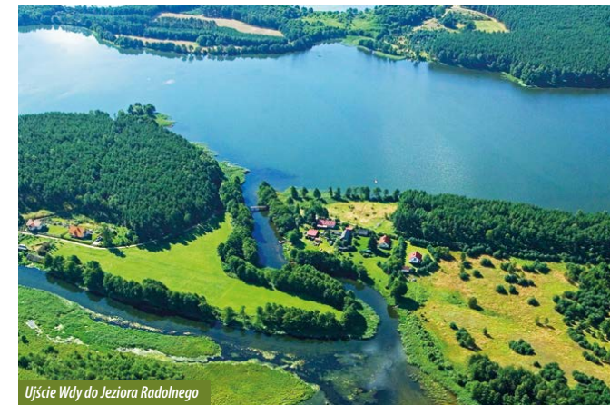
Ujście Wdy do Jeziora Radolnego

Z leśnego parkingu ruszamy drogą w głąb lasu. Przed nami przedostatni przystanek szlaku rowerowego, dotyczący drzewostanu nasiennego. Jest to wyłączony obszar lasu, z którego pozyskuje się nasiona do hodowli nowych drzewek.