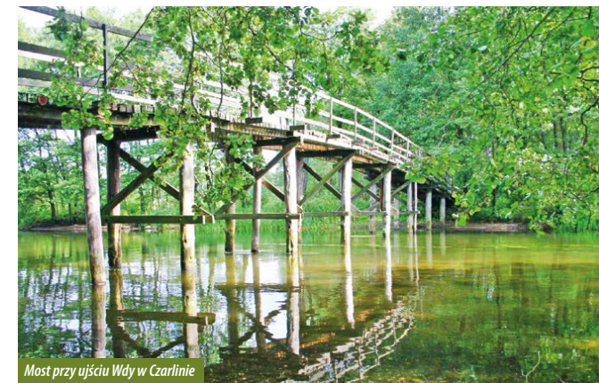
Most przy ujściu Wdy w Czarlinie

informacje na temat projektowanego rezerwatu przyrody „Dolina Wdy i Trzebiochy”