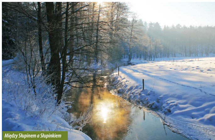
Między Słupinem a Słupinkiem