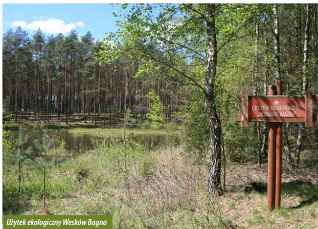
Użytek ekologiczny Wesków Bagna