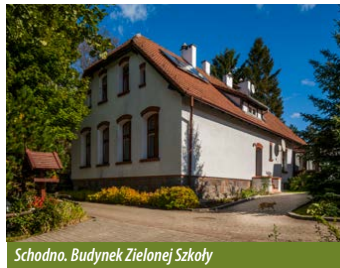
Schodno. Budynek Zielonej Szkoły

Jazdę rozpoczynamy przy Zielonej Szkole, gdzie znajduje się mapa WPK. Stąd, kierując się oznakowaniem, udajemy się w stronę wsi, by po chwili skręcić w lewo i kierować się na południe. Po drodze mijamy hydrofitową oczyszczalnię ścieków. Dzięki wykorzystaniu naturalnych procesów zachodzących na terenach bagiennych i zdolności roślin do oczyszczania wody z biogenów, oczyszczalnia ta skutecznie oczyszcza ścieki dowożone z okolicznych zabudowań, nie stanowiąc obciążenia dla środowiska naturalnego. Dodatkowo nie wymaga ona stałej obsługi. Niedaleko oczyszczalni warto zobaczyć użytek ekologiczny „Żabińskich Błoto”, Śródleśne torfowisko przejściowe z oczkiem wodnym, na którym znajduje się kładka edukacyjna.