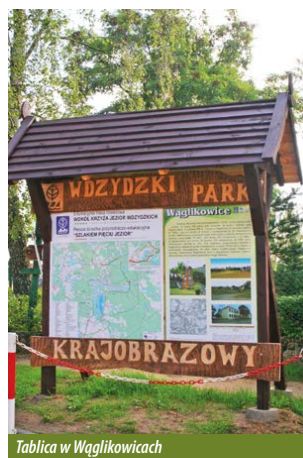
Tablica w Wąglikowicach

Wychodzimy z lasu. Droga prowadzi nas brzegiem pól. Po prawej stronie rozciąga się widok na jezioro Białe. Skracając w lewo ponownie wchodzimy do lasu. Do tej pory na trasie występował bór sosnowy. Tu znajdziemy inne drzewa iglaste: świerki i modrzewie, a w runie leśnym mchy, paprocie i rośliny zielne charakterystyczne dla siedlisk wilgotnych. Po lewej stronie mijamy jezioro Kramsko Duże. Brzeg jest tu zalesiony, stromy, a nad wodą rozciągają się trzcinowiska. To świetne