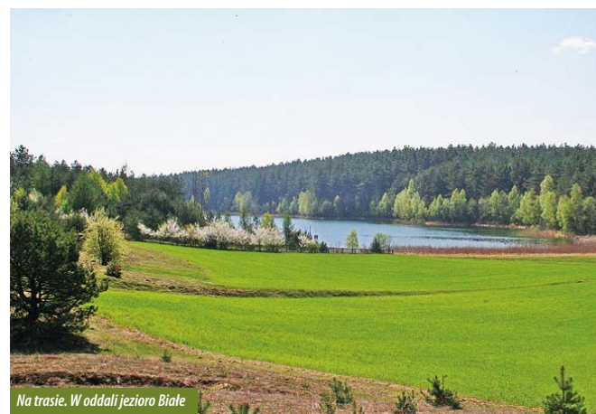
Na trasie. W oddali jezioro Białe

Docieramy do skrzyżowania i skręcamy w lewo. Zatrzymujemy się nad rzeką Dębrznicą, lewostronnym dopływem Trzebiochy, drugiej co do wielkości rzeki we Wdzydzkim Parku Krajobrazowym. Umieszczona w pobliżu tablica edukacyjna przybliży nam wybraną roślinność występującą nad i w korycie cieku oraz szczególną i cenną dla Parku odmianę troci jeziorowej.