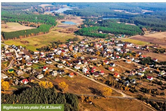
Wąglikowice z lotu ptaka

Ścieżka prowadzi poza teren wsi, mijamy cmentarz i wchodzimy do lasu. Kierując się znakami na drzewach, dochodzimy do pierwszego przystanku z tablicą „Jeziora”. Znajdziemy tu informacje o jeziorach mijanych w trakcie wycieczki. Przed nami znajduje się jezioro Kramsko