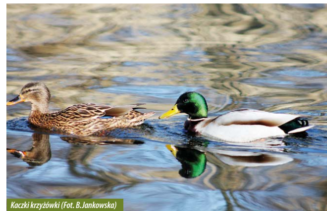
Kaczki krzyżówki

miejsce bytowe dla ptactwa wodnego, zarówno dla gatunków szuwarowych, jak i gniazdujących w dziuplach drzew.