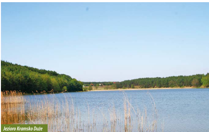
Jezioro Kramsko Duże

Małe, czyste jezioro o łagodnych brzegach. Możemy zaobserwować tu roślinność wodną, taką jak glony ramienice, charakterystyczne dla czystych zbiorników. Na brzegu występuje wiele gatunków turzyc, mięta, przytulia czy niezapominajka błotna.