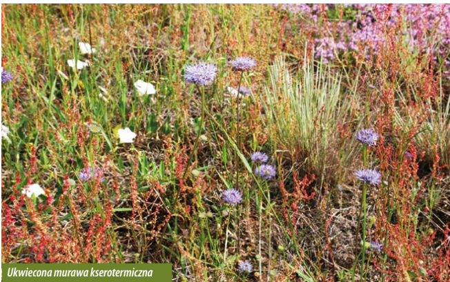
Ukwiecona murawa kserotermiczna

Kontynuujemy wędrówkę i kierując się oznakowaniem szlaku, docieramy do ostatniego przystanku z tablicami edukacyjnymi dotyczącymi lasów Parku oraz zasad zachowania w nich. Wyposażony jest w wiatę, gdzie po trudach wędrówki możemy odpocząć przed powrotem do Wągliwic, a także obserwować znajdujące się w otoczeniu drzewostany sosnowe w różnym wieku.