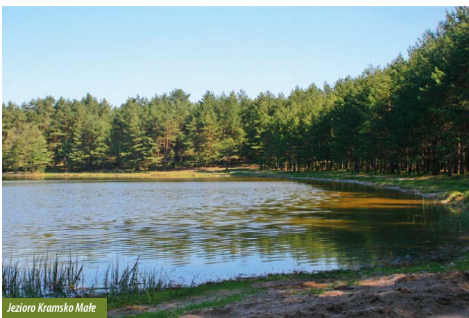
Jezioro Kramsko Małe